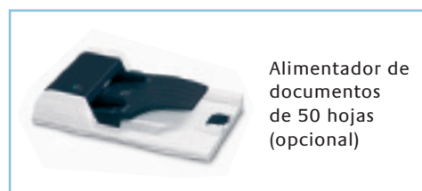
Alimentador de documentos de 50 hojas (opcional)

El modelo mostrado incluye elementos opcionales